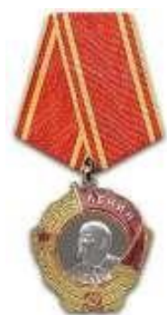
Орден Ленина (1944)