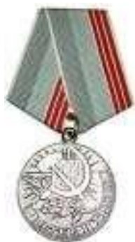
Медаль «Ветеран Труда»

14. Медаль «Виктория» от Комитета ветеранов ВОВ