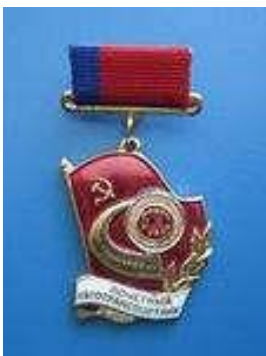
2. Знак «Почётный автотранспортник РСФСР»

ИМЯ КЛЕЙНА Р.А. ВЫСЕЧЕНО НА СТЕНЕ В ЗАЛЕ СЛАВЫ ЦЕНТРАЛЬНОГО МУЗЕЯ ВЕЛИКОЙ ОТЕЧЕСТВЕННОЙ ВОЙНЫ