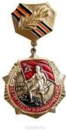
1. Знак «Ветеран войны»