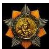
Орден Богдана Хмельницкого 3 степени (1944)