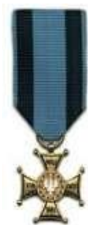
Золотой Крест ордена «Виртути Милитари» («За воинскую доблесть»)