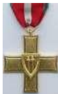
Серебряный Крест «Грюнвальдская битва» (Орден «Грюнвальдский Крест»)